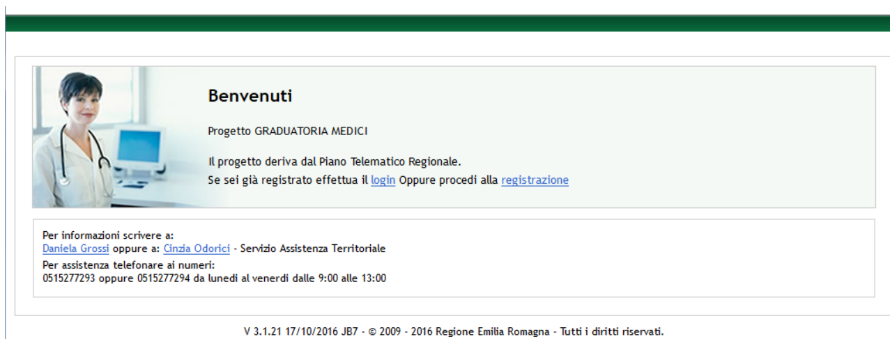
Figura 1 – Pagina di accesso all'applicativo

Collegandosi al sito si visualizza la pagina di accesso (vedi Figura 1).