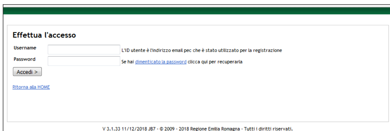
Figura 4 – Accesso utente MMG / PLS

Tramite la medesima schermata (Figura 4) è possibile anche effettuare il recupero della password.