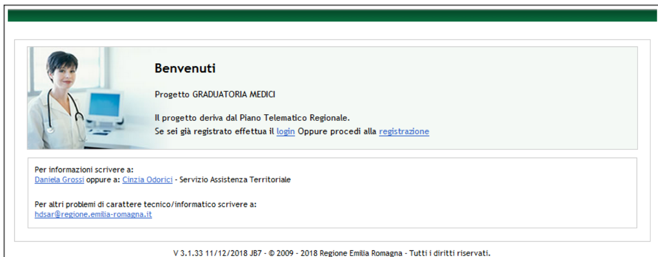
Figura 1 – Pagina di accesso all'applicativo

Collegandosi al sito si visualizza la pagina di accesso (vedi Figura 1).